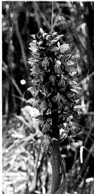
Krever åpenhet. Orkidéer som smalmarihand krever lys og åpen myr for å trives. Fargepraktene er det ingenting å si på.

slåttemyr må også skjottes. Når stavkirkene mangler vedlikehold, snakker vi om kulturpolitisk skandale. Men denne myra ble fredet i 1981, og ennå er det ikke bevilget nødvendige penger til rydding og slått.