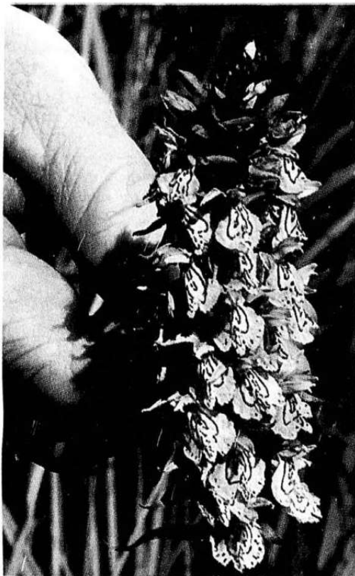
Tydelige mønstre. Skogmarihand er lysere enn smalmarihand, men med mer utpreget mønstrede blomster. Den trives i skogkanten.

I det varme solskinet flagrer en gyllen perlemorsommerfugl sorgløst forbi de sjeldne orkidéene. Som rødilla spir står smalmarihand tett på de åpne, frodige myrflatene. Uti juli slår myrflangre ut sine bleke blomster. Den finnes bare ti steder i Norge.