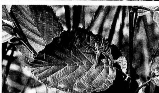
Solbad. Dyrelivet er rikt, men lite kjent. En myrredderkopp slikker sol på et overblad i myrkanten.

at jeg har noen oversikt over hvor mye som brukes til skjøtsel. Men vi trenger helt klart mer enn vi bruker i dag. Har man gjort et vernevedtak som krever skjøtsel, blir det meningsløst om vi ikke følger det opp med konkrete tiltak. I dette arbeidet ønsker vi å involvere lokale krefter, og vi har tilbudt kommunene å overta forvaltningen av verneområdene på frivillig basis.