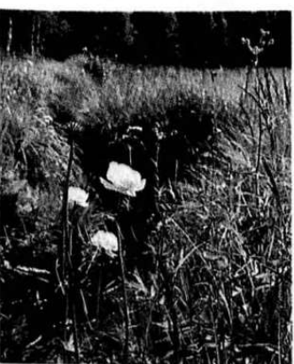
Veksling. Ballblom er i ferd med å blomstre av, men bak begynner den gamle legeplanten vendelrot å blomstre.

Penger eller ikke, Tor Øystein Olsen kan stolt vise frem en myr der mye av ryddingen er gjort.